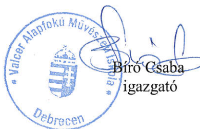
Bíró Csaba igazgató